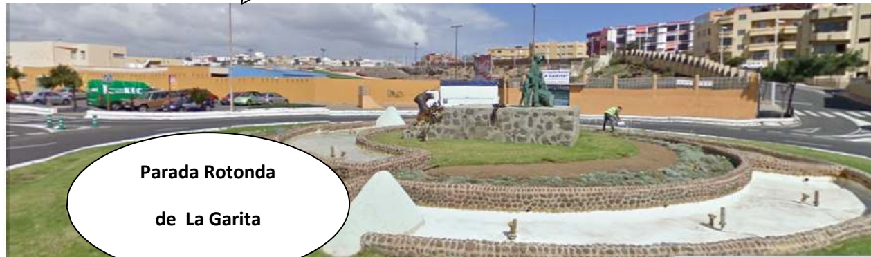
Parada Rotonda de La Garita